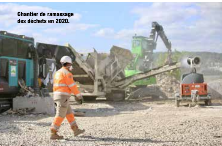
Chantier de ramassage des déchets en 2020.

L a vaste zone, utilisée par le passé pour l'épandage des eaux usées de l'agglomération parisienne, était devenue une friche. Elle s'était même transformée en décharge sauvage à ciel ouvert. Face au risque de pollution, une opération de nettoyage a été lancée pour faire disparaître la "mer de déchets".