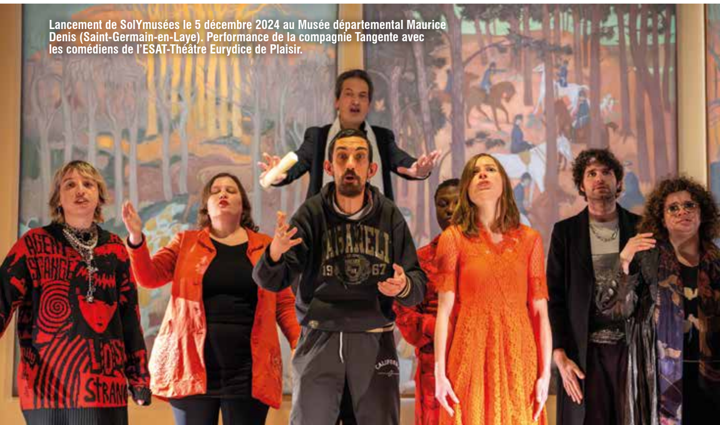
Lancement de SolYmusées le 5 décembre 2024 au Musée départemental Maurice Denis (Saint-Germain-en-Laye). Performance de la compagnie Tangente avec les comédiens de l'ESAT-Théâtre Eurydice de Plaisir.

Les séances, qui ont débuté en décembre, sont animées par Action Handicap France, Culture du Cœur, la Fondation Falret et Culture Accessible. Elles portent sur l'accueil des publics en situation de handicap de mobilité, sur les publics aveugles et malvoyants, sourds et malentendants, sur les