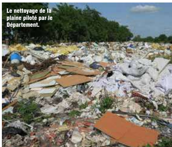
Le nettoyage de la plaine piloté par le Département.

De la "mer de déchets" à la restauration de l'environnement. Depuis 2020, la boucle de Chanteloup-les-Vignes fait l'objet d'un vaste projet de reconquête écologique de 300 hectares porté par le Département.