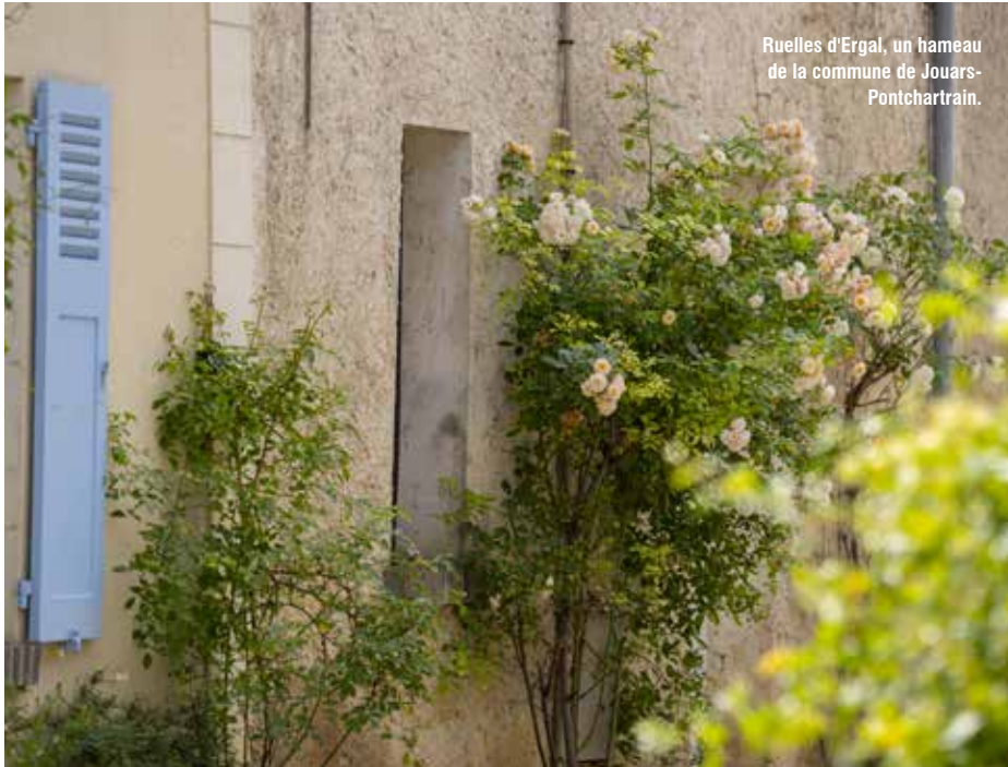
Ruelles d'Ergal, un hameau de la commune de Jouars-Pontchartrain.

rise les efforts d'embellissement et de préservation de l'environnement, permettant ainsi aux communes d'améliorer leur cadre de vie, de gagner en attractivité et de renforcer leur responsabilité environnementale. Parmi les 259 communes yvelinoises, 125 participent activement à cette démarche.