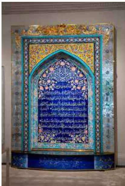
Une khirqa (manteau des soufis) et un mihrab sont exposés au sein du musée.

« Le soufisme n'est pas une religion, mais un courant spirituel »,