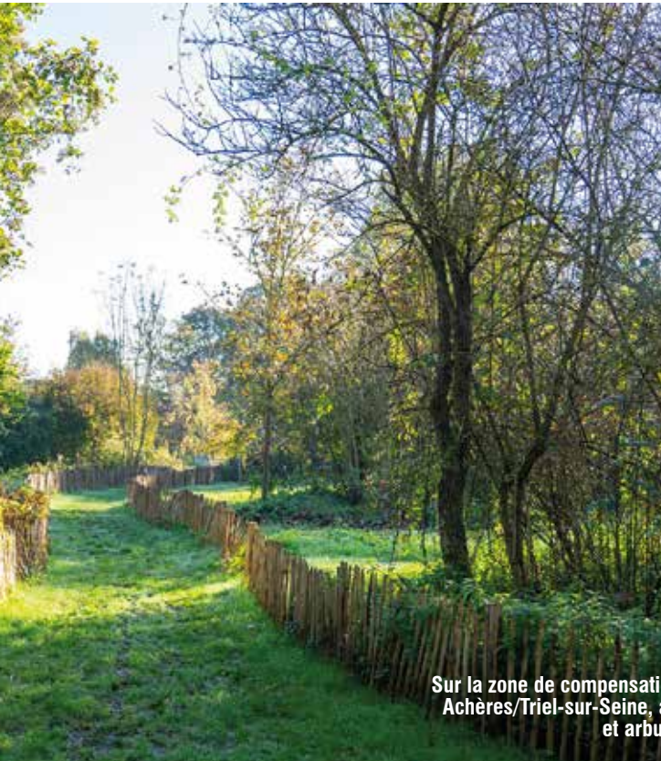
Sur la zone de compensation écologique du pont Achères/Triel-sur-Seine, au total 40 000 arbres et arbustes seront replantés.