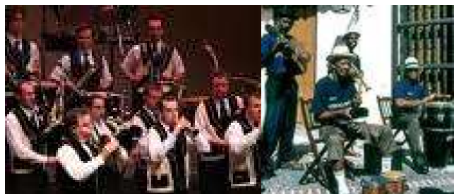
Musiques du monde